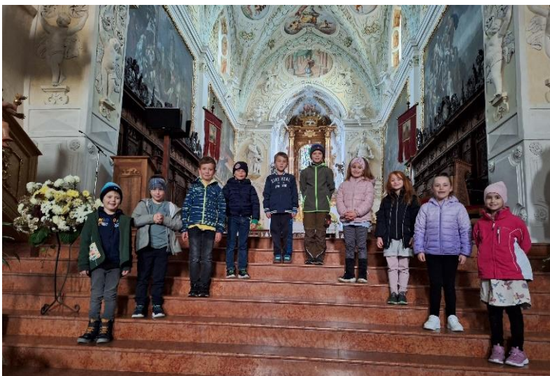
Die Erstkommunion wird am 26. Mai 2024 gefeiert.

Am 19. November stellten sich die Erstkommunionkinder der Pfarrgemeinde vor: